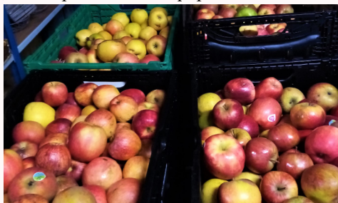
Des invendus récupérés par Sandrine

Suivant les arrivages, « cela peut donner naissance à des saveurs »