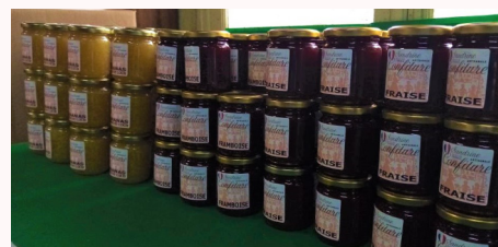
Des milliers de pots sont fabriqués, chaque mois, dans l'atelier Sandrine Saveurs

originales telles que : ananas-coco, patate douce-vanille bourbon, mais encore banane-chocolat, il y en a pour tous les goûts » sourit Sandrine.